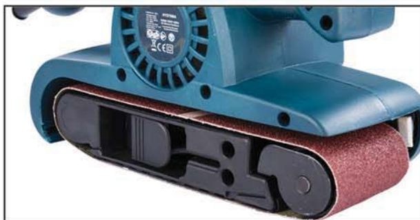
Fül zárva (a csiszolószallag feszes)