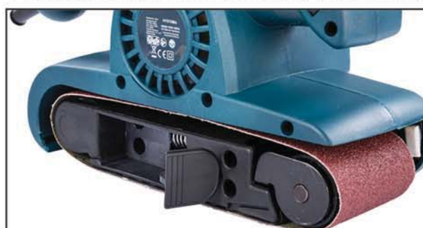
Fül nyitva (a csiszolószallag lecserélhető)