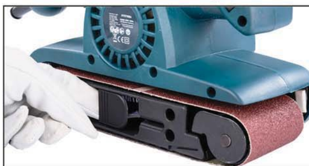
Fül kinyitása (a csiszolószallag fellazítása)