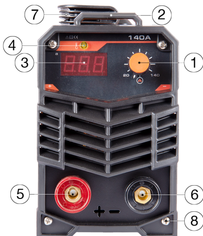
A 140i típus

Szállításkor a gépet kapcsolja ki minden esetben!